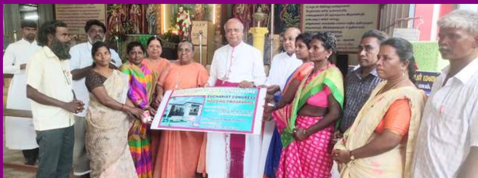
EUCCHARISTIC CONGRESS - HOUSING PROGRAM