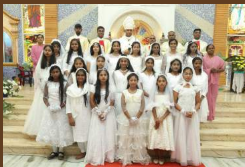
CONFIRMATION - ST PAUL CHURCH - THIRUVOTTIYUR