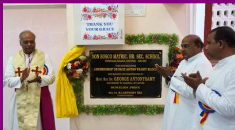
NEW SCIENCE BLOCK - SRINIVASA NAGAR