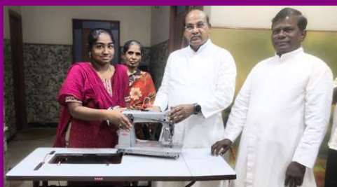
MSSS - LIVELIHOOD SUPPORT