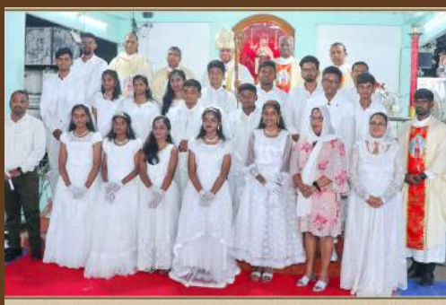
CONFIRMATION - ST. BRITTO CHURCH - VILLIVAKKAM