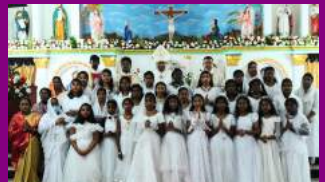
NEW PRESBYTERY - THIRUVOTTIYUR