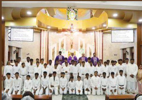
CONFIRMATION - ST. ANTONY CHURCH - MOGAPPAIR WEST