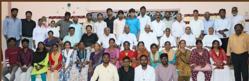
VBS TRAINING CAMP, TINDIVANAM - BIBLE COMMISSION