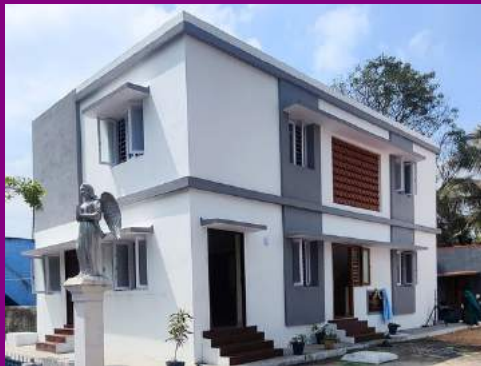
NEW PRESBYTERY - KADAMBATTUR