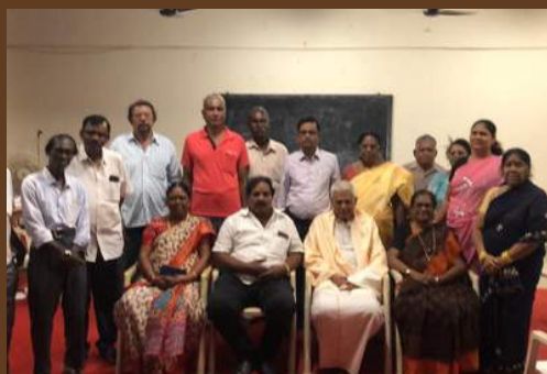
CHRISTIAN RENEWAL MOVEMENT OF INDIA