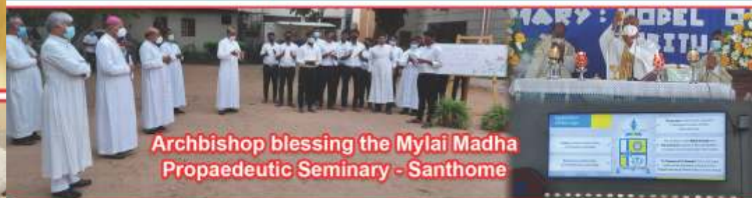
Archbishop blessing the Mylai Madha Propaedeutic Seminary - Santhome