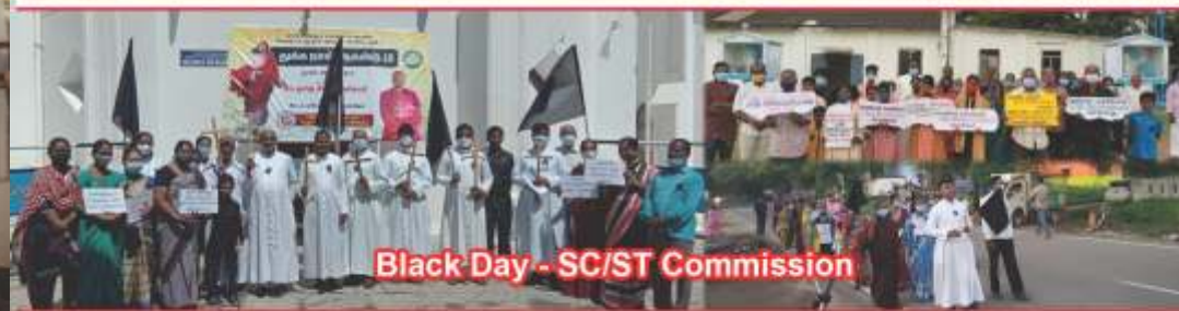
Black Day - SC/ST Commission