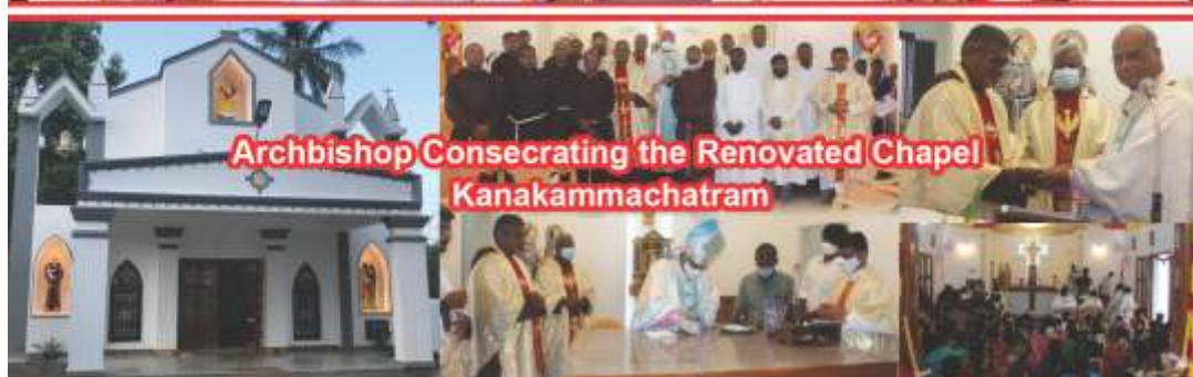
Archbishop Consecrating the Renovated Chapel Kanakammachatram

Independence Day Inter-Religious Prayer Service - Avadi. HVF