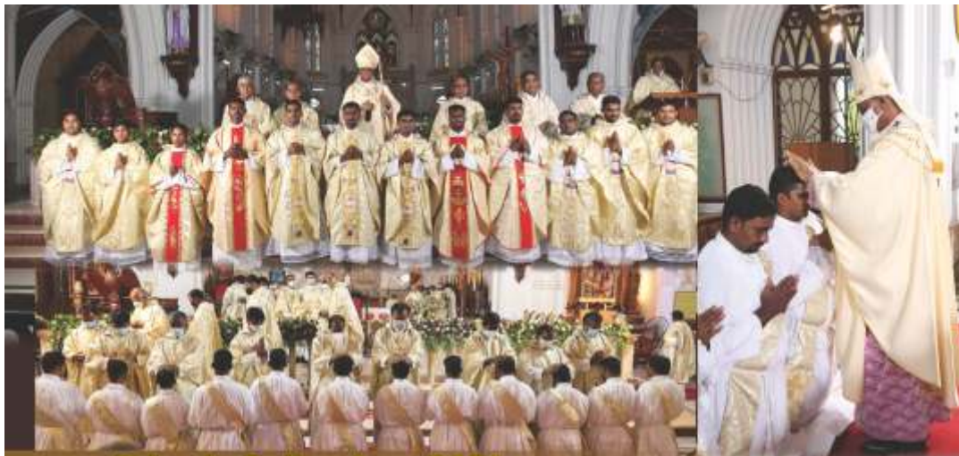
Priestly Ordination - 2021