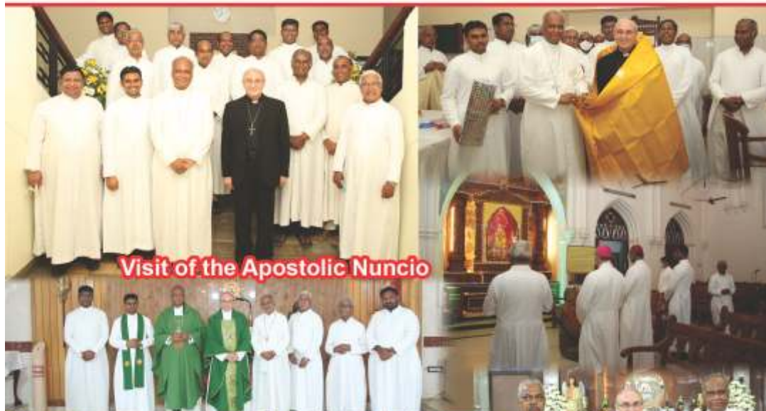
Visit of the Apostolic Nuncio