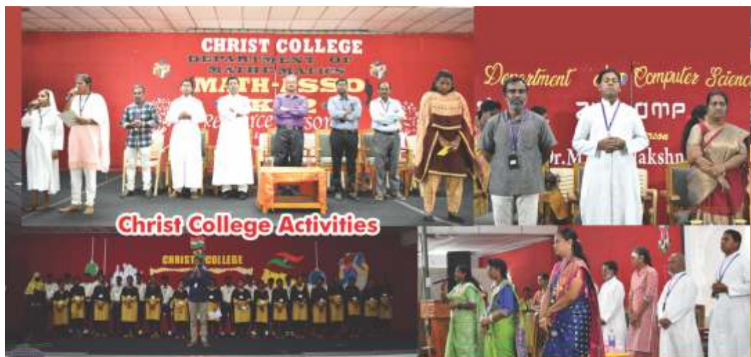
Christ College Activities