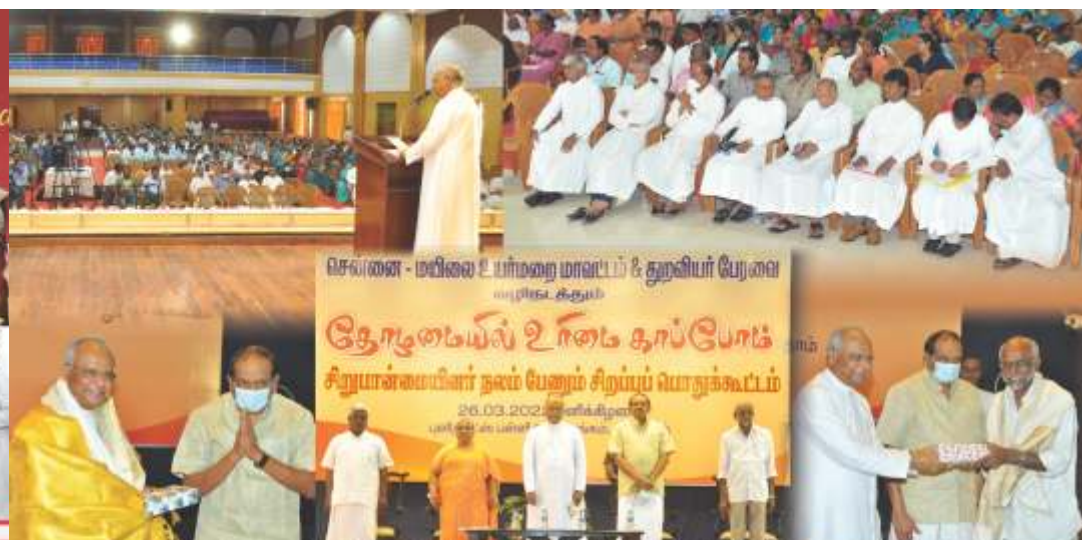
Seminar on Protection of Human Rights