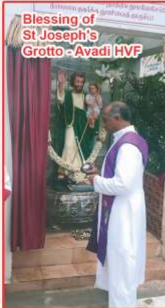
Blessing of St Joseph's Grotto - Avadi HVF