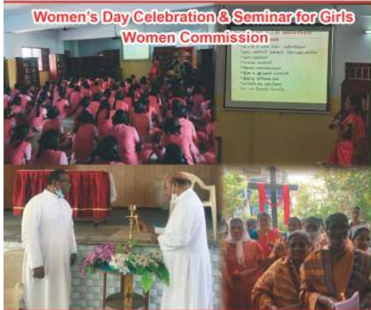
Women's Day Celebration & Seminar for Girls Women Commission