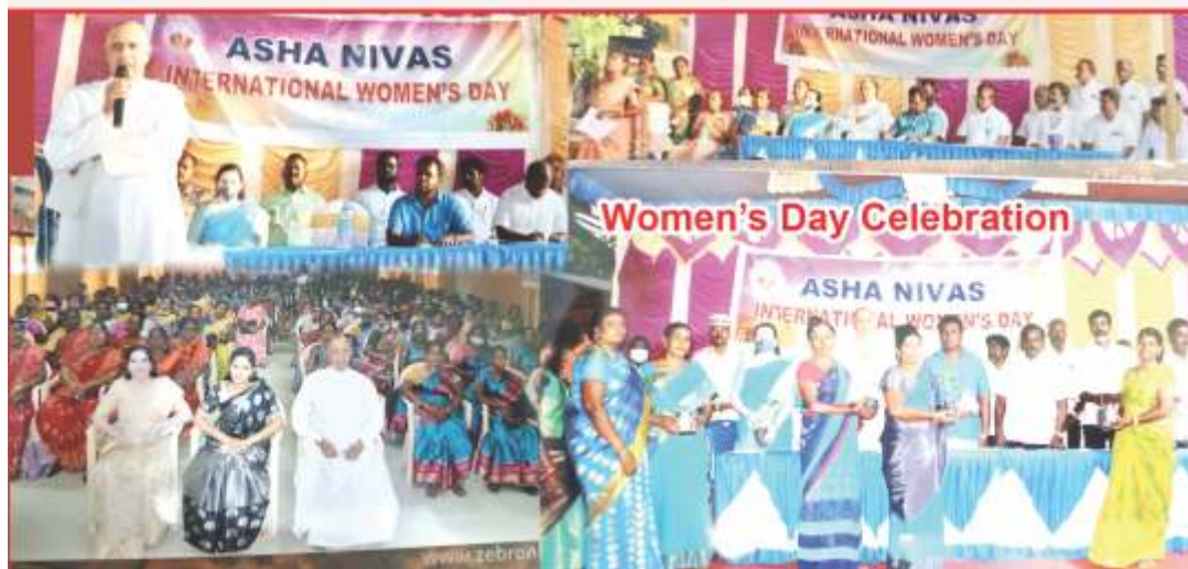
Women's Day Celebration